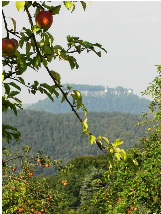
Blick auf Königstein

Schwierigkeitsgrad: mittel Streckenlänge: ca. 115 km Mindestteilnehmer: 2 Personen